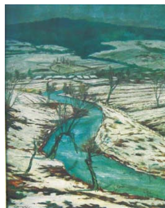
BRÁNSKY Ľudovít: Nižný Komárnik 1955, olej, plátno, 100x70