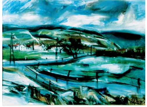
TRNKA Jaroslav: Duklianske bojisko – Korejovce ; 1981, pastel, papier, 43x60