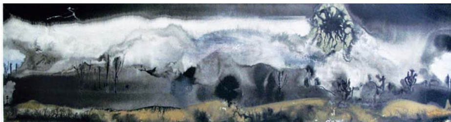
NEMČÍK Július: Krajina pri Dukle ; 1969, komb. technika, papier, 17x83