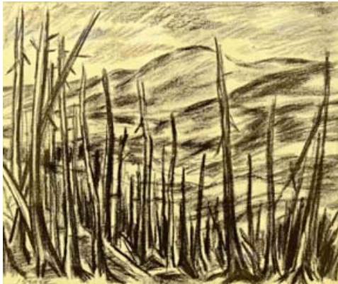
ŠEBEK Jiří: Duklianske bojisko 1969, kresba, papier, 38x45