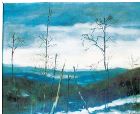
BRÁNSKY Ľudovít: Krajina 1955, olej, plátno, 50x70