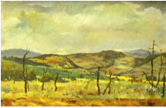
BRÁNSKY Ludovít: Duklianske bojisko v Poľsku ; 1954, olej, preglejka, 58x89